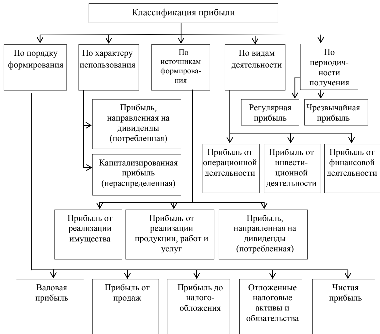
Рисунок 2 – Классификация прибыли

Оформление ссылок. Библиографическая ссылка предусматривает расположение информации об источнике в списке литературы. При упоминании автора работы или работ в квадратных скобках указывается номер источника в пределах списка литературы, например [6]. При ссылке на несколько работ одного автора или работы нескольких авторов приводят номера этих работ, например: [1,7,22]. При ссылке на определенные страницы указывают порядковый номер источника и страницу, на которой расположен данный текст, например: [11, с.72]. Если ссылка на многотомное издание, кроме того, указывают номер тома, например: [12, т.1, с.455].